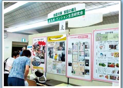
生活展パネル展示