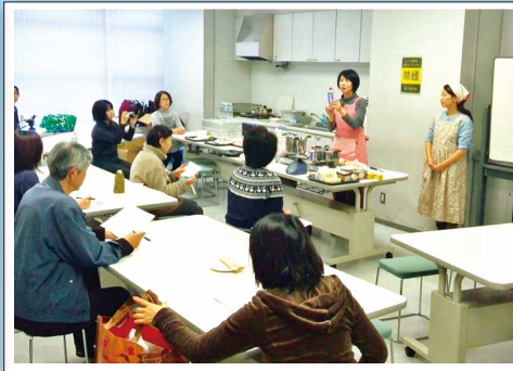
被災時クッキング講座