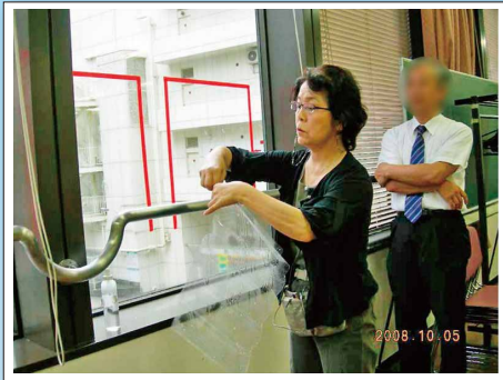
ガラス飛散防止対策実演

首都直下地震に備え、地震対策を生活者目線で提案するグループです。防災グッズ選びや、家庭内の安全対策に取り組み、「防災は自助から」をスローガンに講座や展示会を開いています。