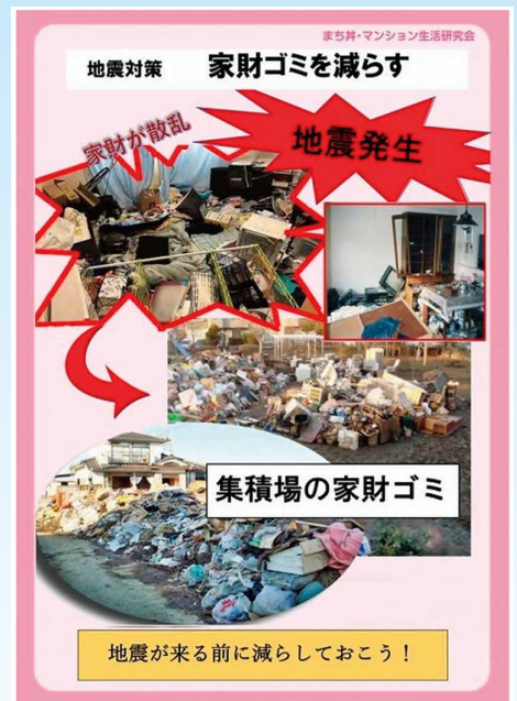
家財ごみを減らす