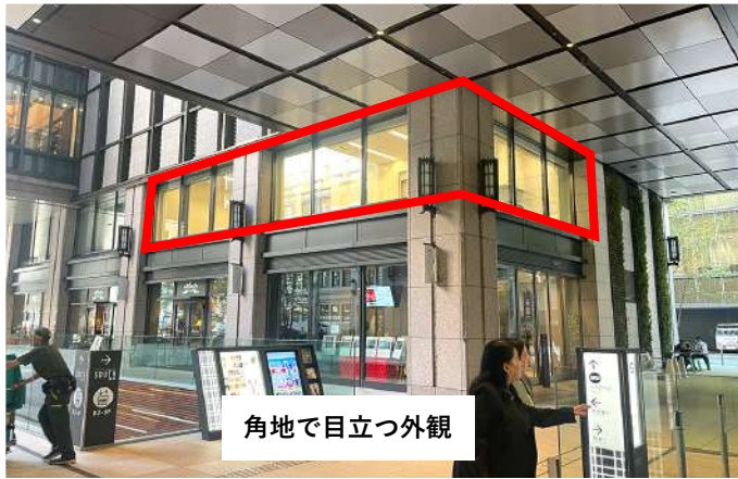
角地で目立つ外観