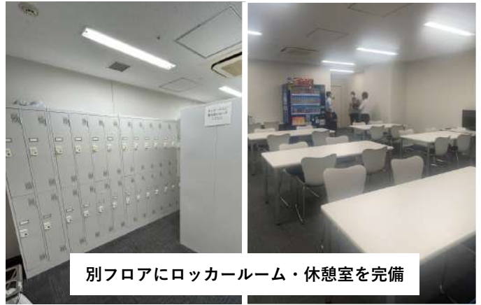
別フロアにロッカールーム・休憩室を完備