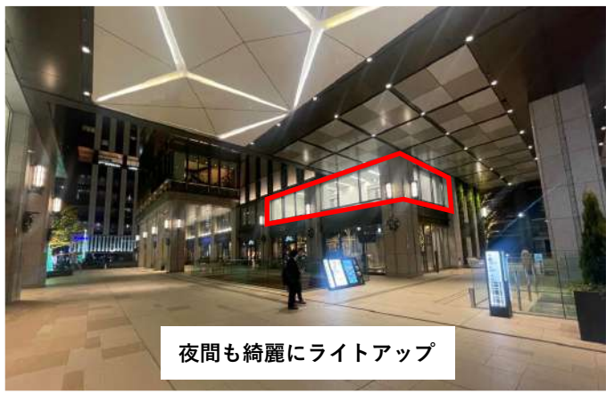
夜間も綺麗にライトアップ