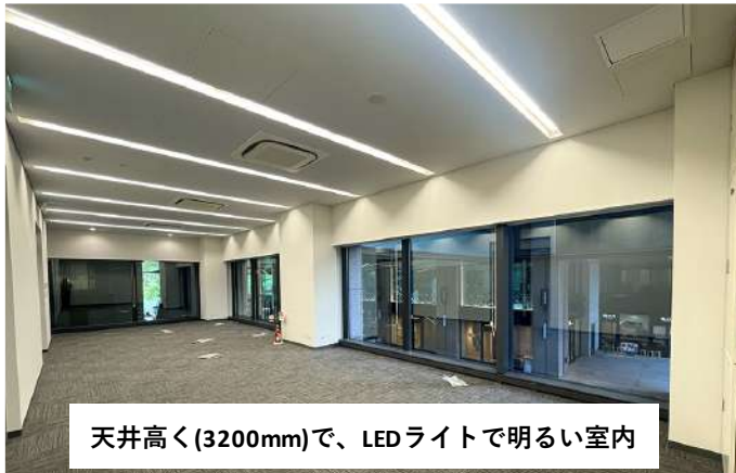
天井高く(3200mm)で、LEDライトで明るい室内